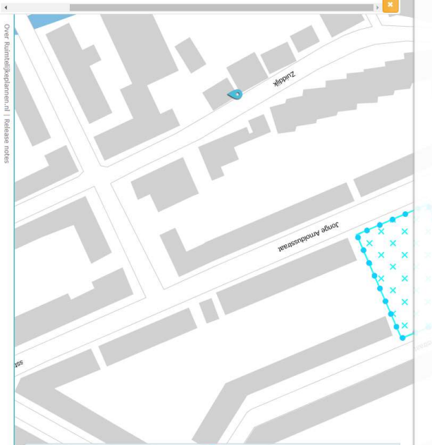
Over ruimtelijkeplannen.nl | Release notes